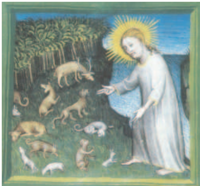
Miniatura del XV sec. Biblioteca Mazarino.

Intervento al Convegno promosso dall'Ufficio Cei Emilia Romagna per i problemi sociali, il lavoro, la giustizia e la pace (Imola 28 maggio 2005)