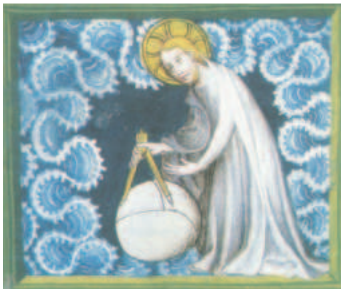
Miniatura del XV sec., Biblioteca Mazarino.

Francesco d'Assisi scrive il Cantico alla fine della sua vita, quando, immerso ormai nelle infermità riceve assicurazione dal Signore della preziosità della sua vita, attraverso una visione della terra trasformata in oro fino che egli accoglie come dono. In questa